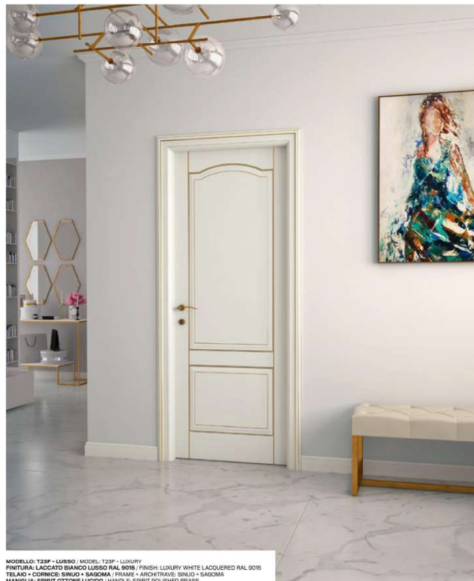
MODELLO: T23F - LUSO / MODEL: T23F - LUXURY FINITURA: LACCATO BIANCO LUSO RAL 9016 / FINISH: LUXURY WHITE LACQUERED RAL 9016 TELAIO + CORNICE: SINUO + SAGOMA / FRAME + ARCHITRAVE: SINUO + SAGOMA MANIGLIA: SPIRIT OTTONE LUCIDO / HANDLE: SPIRIT POLISHED BRASS

Una finitura molto delicata che valorizza le linee. La vernice, giallo oro o in altri colori a scelta, delinea i bordi della pantografatura e dei montanti. La stesura del colore viene fatta a mano, per questo l'effetto finale di naturalezza è una caratteristica unica. A very delicate finish that enhances the lines. The yellow gold paint or other colours outline the edges of the pantograph and the uprights. The door is hand painted so the final effect of naturalness is a unique feature.