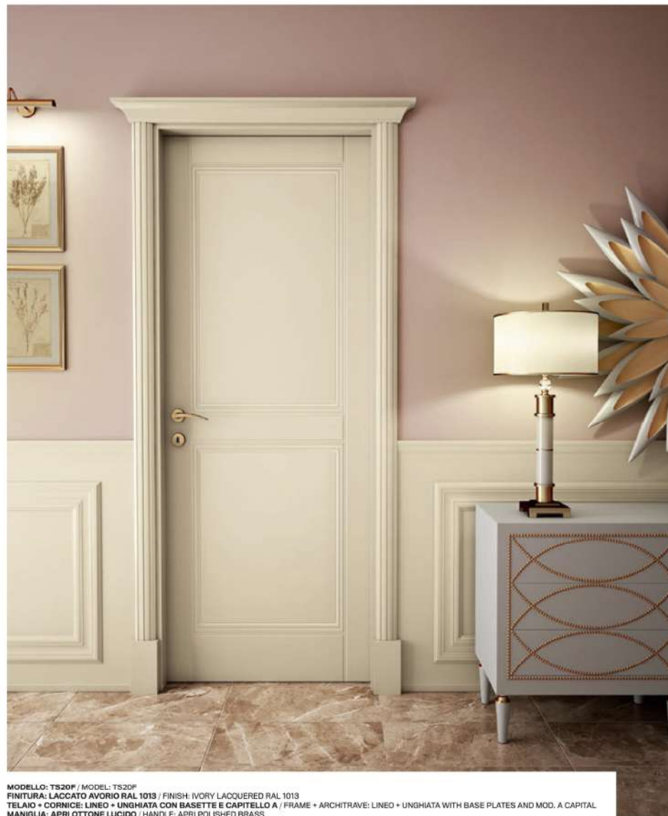
MODELLO: TS20P / MODEL: TS20P FINITURA: LACCATO AVORIO RAL 1013 / FINISH: IVORY LACQUERED RAL 1013 TELAIO + CORNICE: LINEO + UNGHIATA CON BASETTE E CAPITELLO A / FRAME + ARCHITRAVE: LINEO + UNGHIATA WITH BASE PLATES AND MOD. A CAPITAL MANIGLIA: APRI OTTONE LUCIDO / HANDLE: APRI POLISHED BRASS

Una lavorazione che arricchisce l'estetica della porta senza appesantirla, creando un gioco di luce molto raffinato. È una soluzione dallo stile ricco, insolita e originale. Sono possibili personalizzazioni con disegni forniti dal cliente. A process that enhances the aesthetics of the door without weighing it down, creating a very refined play on light. It is a solution with a rich, unusual and original style. Customisations are possible with designs provided by the customer.