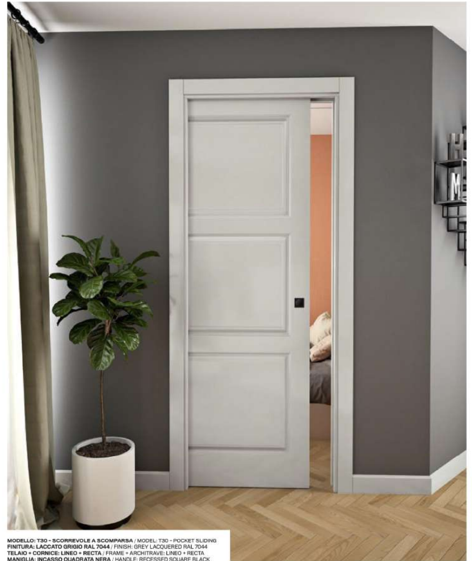
MODELLO: T30 - SCORREVOLE A SCOMPARSA / MODEL: T30 - POCKET SLIDING FINITURA: LACCATO GRIGIO RAL 7044 / FINISH: GREY LACQUERED RAL 7044 TELAIO • CORNICE: LINEO • RECTA / FRAME • ARCHITRAVE: LINEO • RECTA MANIGLIA: INCASSO QUADRATA NERA / HANDLE: RECESSED SQUARE BLACK

La pantografatura tradizionale richiama l'estetica della bugna attraverso geometrie squadrate o arrotondate e valorizza, così, lo spessore e la qualità del legno. Sono possibili personalizzazioni con disegni forniti dal cliente. The traditional pantograph recalls the aesthetics of embossing through square or rounded geometries and thus enhances the thickness and quality of the wood. Customisations are possible with designs provided by the customer.