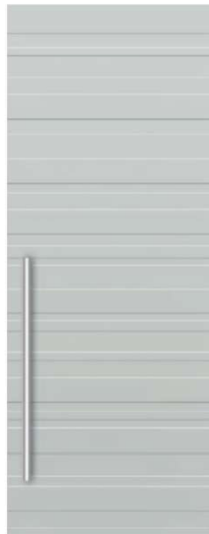
MOD. TL00 RAL 7035