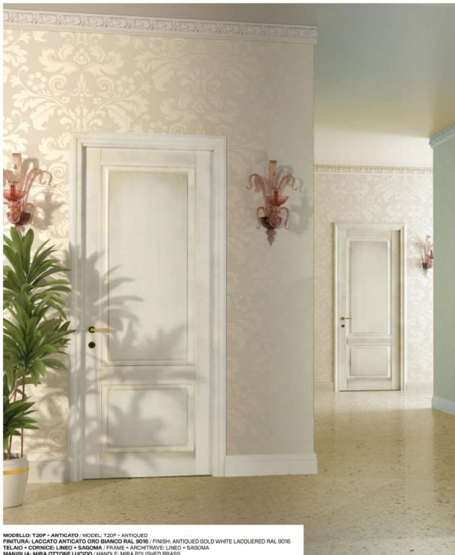
MODELLO: T20P - ANTICATO / MODEL: T20P - ANTIQUED FINITURA: LACCATO ANTICATO ORO BIANCO RAL 9016 / FINISH: ANTIQUED GOLD WHITE LACQUERED RAL 9016 TELAIO + CORNICE: LINEO + SAGOMA / FRAME + ARCHITRAVE: LINEO + SAGOMA MANIGLIA: MIRA OTTONE LUCIDO / HANDLE: MIRA POLISHED BRASS