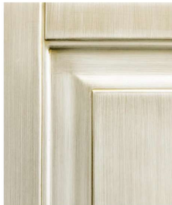
La superficie del legno è resa irregolare con un risultato che simula i segni del tempo, con evidenza soprattutto sugli angoli, negli interstizi e nelle modanature. Una lavorazione totalmente manuale che rende unica ogni porta. The wood surface is made uneven with a result that mimics the signs of ageing, especially highlighted at the corners, in the interstices and mouldings. A totally manual process that makes each door unique.