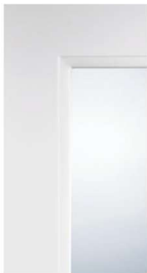
DETTAGLIO / DETAIL