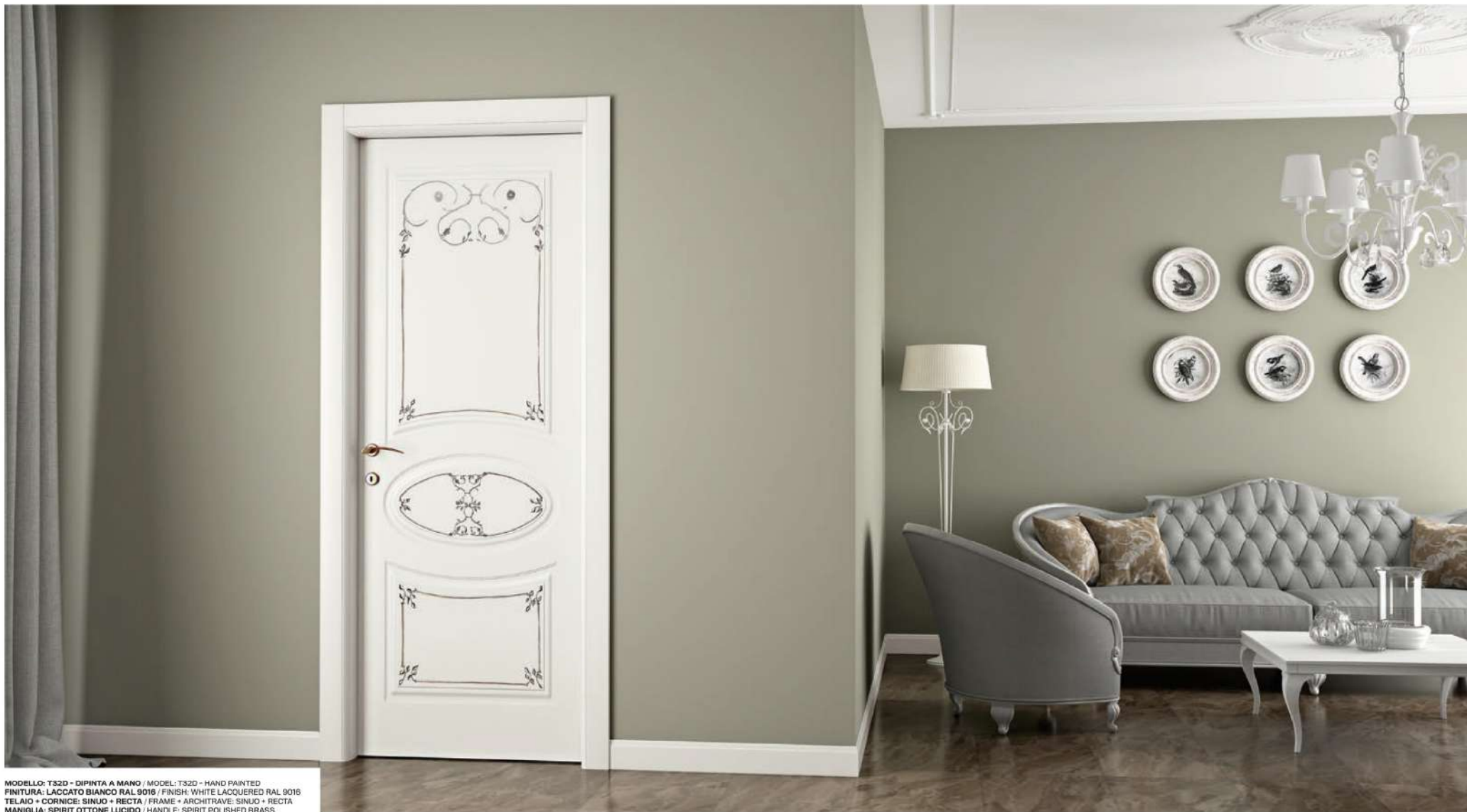
MODELLO: TS2D - DIPINTA A MANO / MODEL: TS2D - HAND PAINTED FINITURA: LACCATO BIANCO RAL 9016 / FINISH: WHITE LACQUERED RAL 9016 TELAIO + CORNICE: SINUO + RECTA / FRAME + ARCHITRAVE: SINUO + RECTA MANIGLIA: SPIRIT OTTONE LUCIDO / HANDLE: SPIRIT POLISHED BRASS