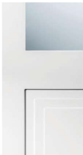
DETTAGLIO / DETAIL