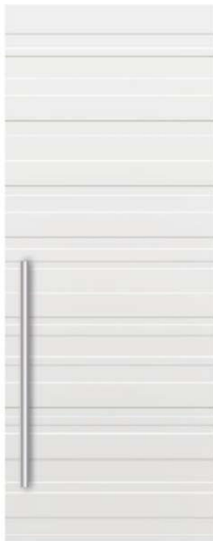
MOD. TL00 RAL 9016

Disponibili anche tutte le altre finiture laccate. Modelli disponibili solo per porte scorrevoli. Other types of lacquered finishes are also available. Models only available for sliding doors.