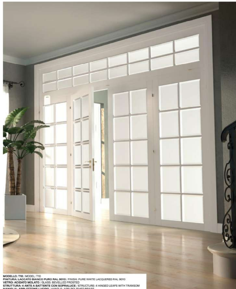
MODELLO: T10 / MODEL: T10 FINITURA: LACCATO BIANCO PURO RAL 9010 / FINISH: PURE WHITE LACQUERED RAL 9010 VETRO: ACIDATO MOLATO / GLASS: BEVELLED FROSTED STRUTTURA: 4 ANTE A BATTENTE CON SOPRALLUCE / STRUCTURE: 4 HINGED LEAFS WITH TRANSOM MANIGLIA: APRI OTTONE LUCIDO / HANDLE: APRI POLISHED BRASS

Una soluzione che evoca le eleganti vetrate d'altri tempi. I singoli vetri sono qui divisi da listelli in legno massello, che conferiscono robustezza e un fascino particolare. A solution that evokes the elegant windows of days gone by. The individual panes are divided here by solid wood slats, which confer strength and a particular charm.