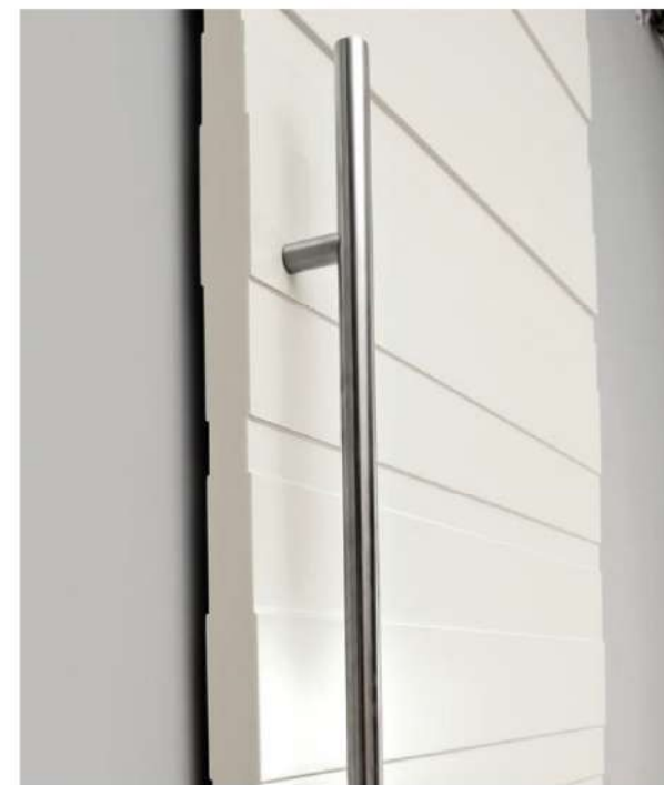
Una particolare lavorazione a fasce riprodotta su entrambi i lati dell'anta, per un effetto tridimensionale unico. Questo decoro è realizzabile solo nella versione scorrevole, data la lavorazione molto profonda che ne limita l'aderenza contro il telaio. A special stripped process on both sides of the door, for a unique three-dimensional effect. This decoration can only be achieved in the sliding version, given the very deep processing that limits the ability to effectively adhere to the frame.