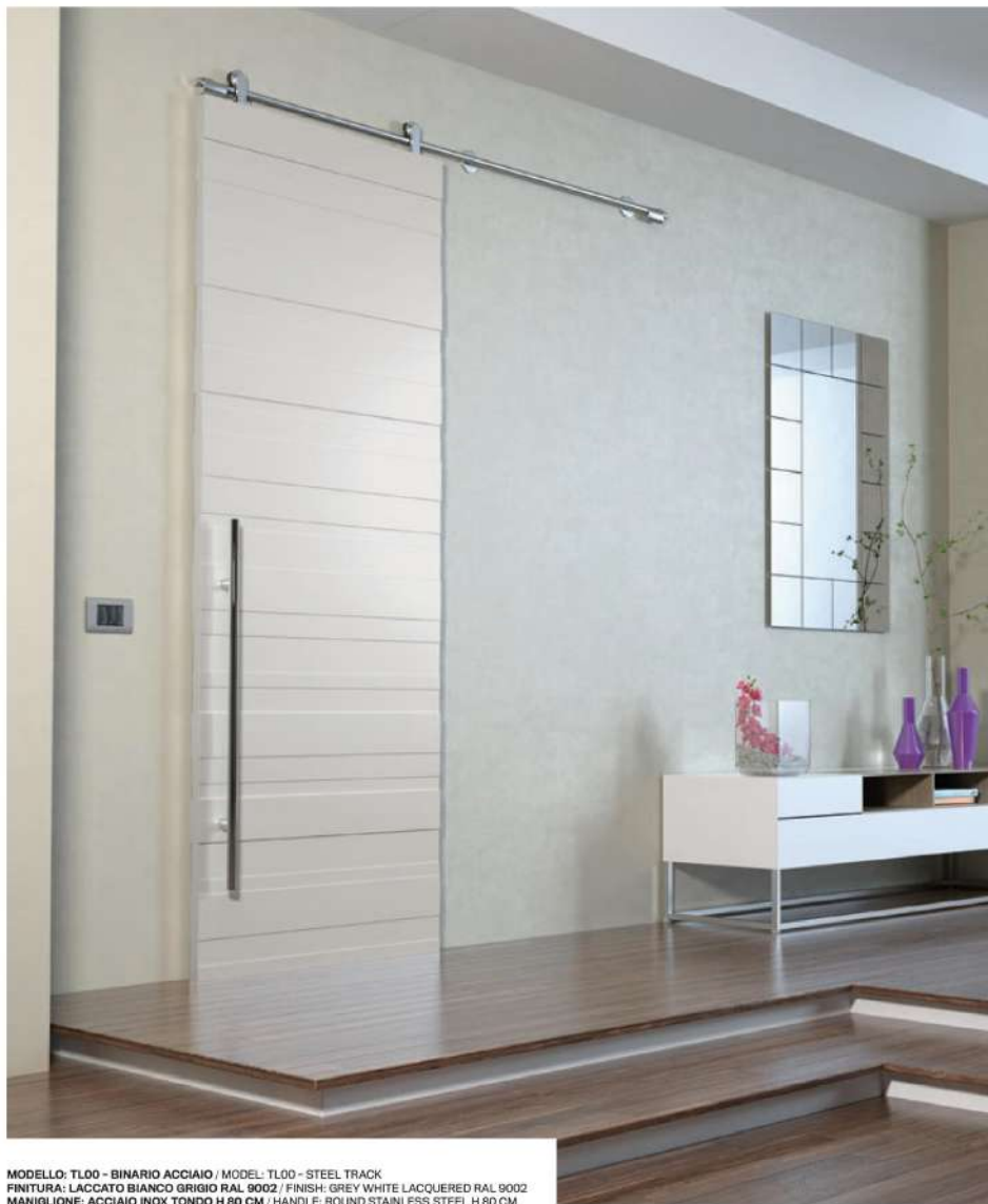
MODELLO: TL00 - BINARIO ACCIAIO / MODEL: TL00 - STEEL TRACK FINITURA: LACCATO BIANCO GRIGIO RAL 9002 / FINISH: GREY WHITE LACQUERED RAL 9002 MANIGLIONE: ACCIAIO INOX TONDO H 80 CM / HANDLE: ROUND STAINLESS STEEL H 80 CM