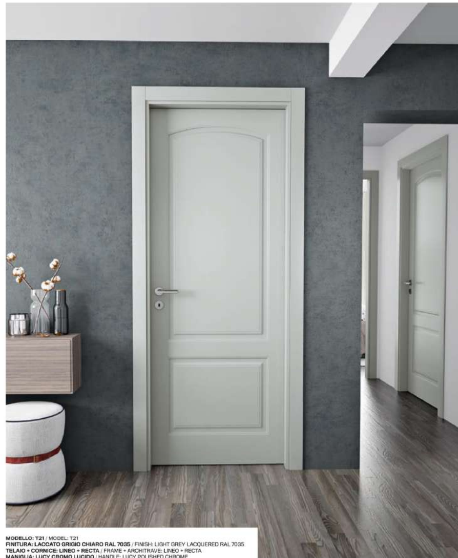
MODELLO: T21 / MODEL: T21 FINITURA: LACCATO GRIGIO CHIARO RAL 7035 / FINISH: LIGHT GREY LACQUERED RAL 7035 TELAIO + CORNICE: LINEO + RECTA / FRAME + ARCHITRAVE: LINEO + RECTA MANIGLIA: LUCY CROMO LUCIDO / HANDLE: LUCY POLISHED CHROME