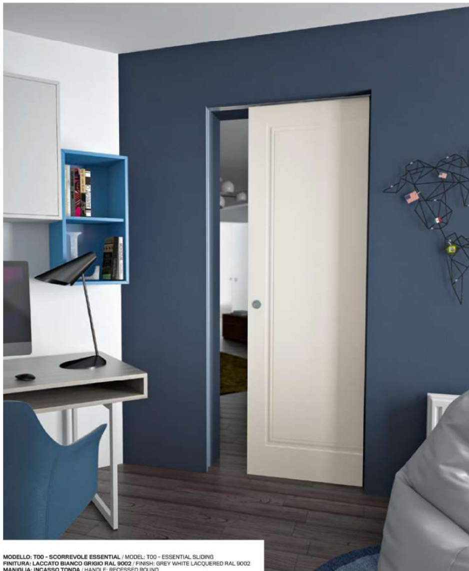
MODELLO: T00 - SCORREVOLE ESSENTIAL / MODEL: T00 - ESSENTIAL SLIDING FINITURA: LACCATO BIANCO GRIGIO RAL 9002 / FINISH: GREY WHITE LACQUERED RAL 9002 MANIGLIA: INCASSO TONDA / HANDLE: RECESSED ROUND