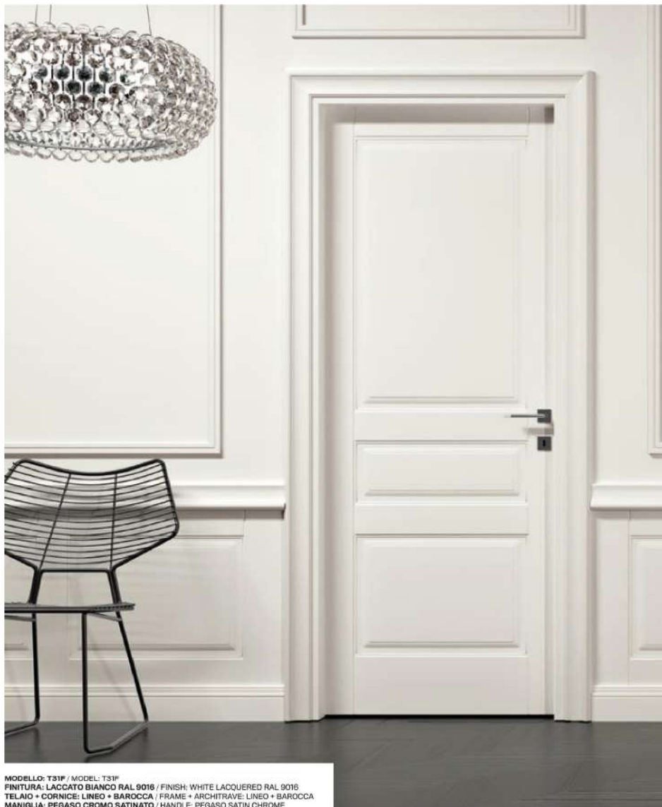
MODELLO: T31P / MODEL: T31P FINITURA: LACCATO BIANCO RAL 9016 / FINISH: WHITE LACQUERED RAL 9016 TELAIO + CORNICE: LINEO + BAROCCA / FRAME + ARCHITRAVE: LINEO + BAROCCA MANIGLIA: PEGASO CROMO SATINATO / HANDLE: PEGASO SATIN CHROME