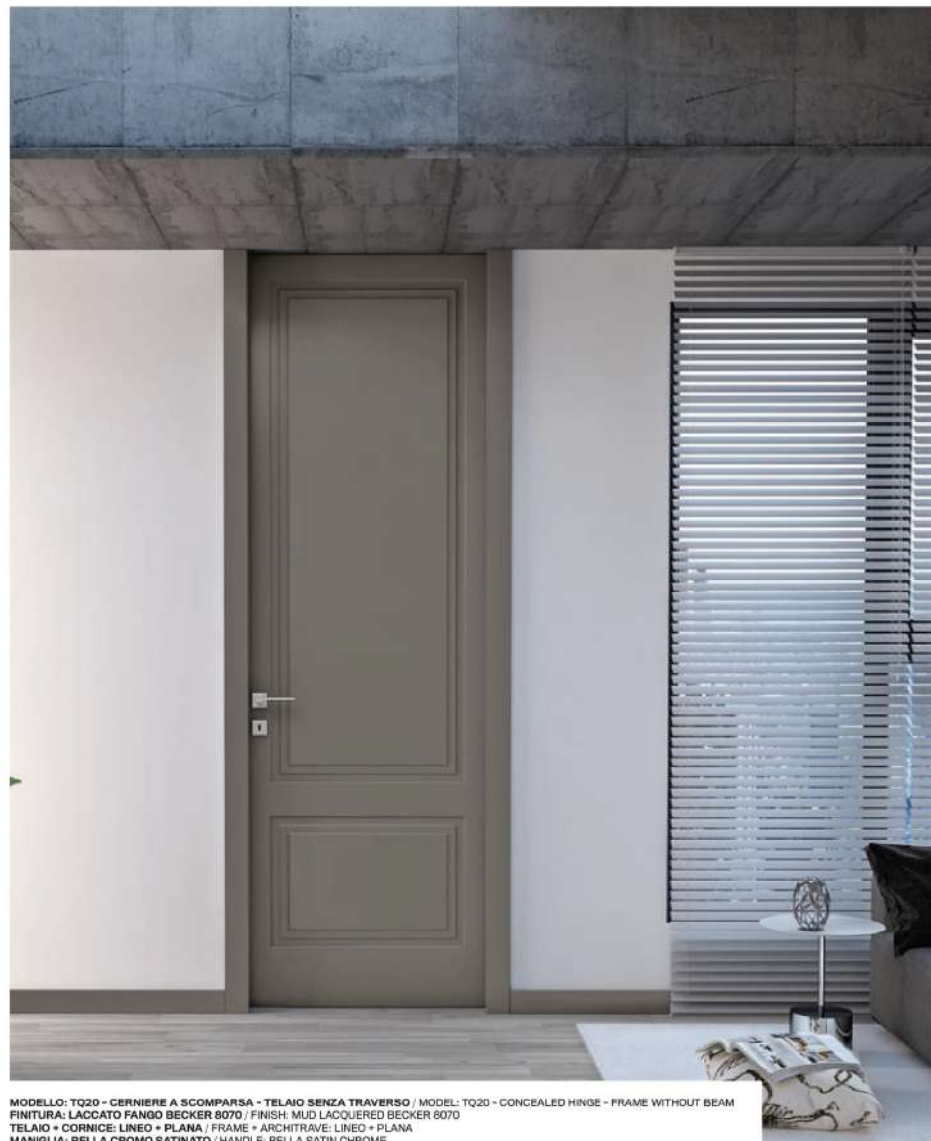
MODELLO: TQ20 - CERNIERE A SCOMPARSA - TELAIO SENZA TRAVERSO / MODEL: TQ20 - CONCEALED HINGE - FRAME WITHOUT BEAM FINITURA: LACCATO FANGO BECKER 8070 / FINISH: MUD LACQUERED BECKER 8070 TELAIO + CORNICE: LINEO + PLANA / FRAME + ARCHITRAVE: LINEO + PLANA MANIGLIA: BELLA CROMO SATINATO / HANDLE: BELLA SATIN CHROME

È una decorazione in stile moderno, un doppio disegno squadrato e regolare che sfrutta i volumi e lo spessore del legno per creare giochi di luce accattivanti. Sono possibili personalizzazioni con disegni forniti dal cliente. It is in modern decoration with a double square and even design that exploits the volumes and thickness of the wood to create captivating light effects. Customisations are possible with designs provided by the customer.