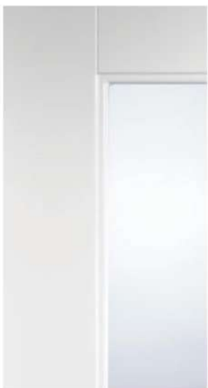
DETTAGLIO / DETAIL