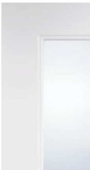
DETTAGLIO / DETAIL