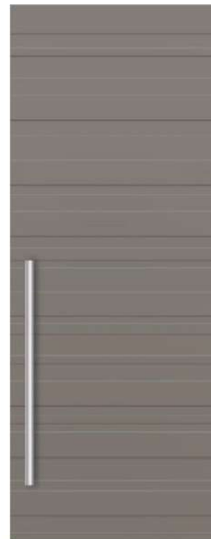
MOD. TL00 BECKER 8070