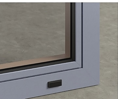
profili esterne mono o bicolore in alluminio con angoli saldati (sistema brevettato)